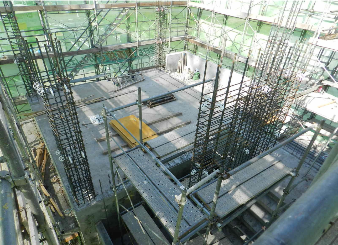
6月3日 新庁舎 壁・梁型枠組立