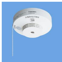
↑住宅用火災警報器